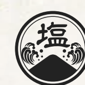
200 SHIO Ramen 塩ラーメン 12.90