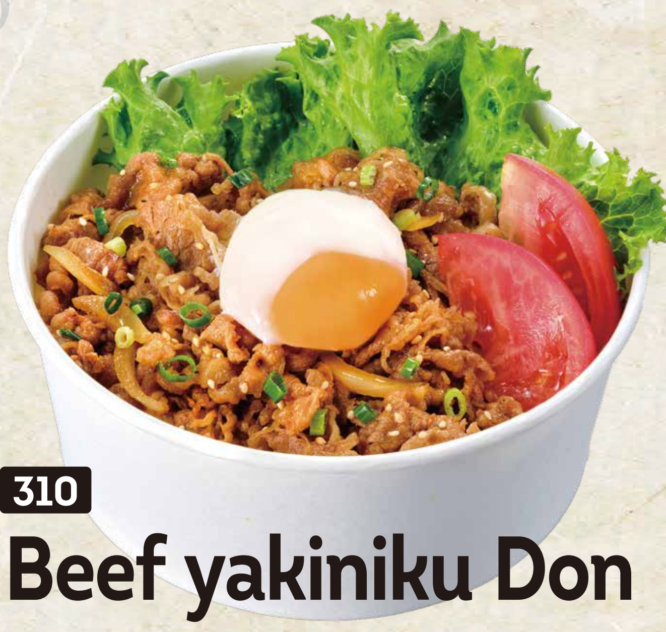
310 Beef yakiniku Don 和風牛焼肉丼 12.90