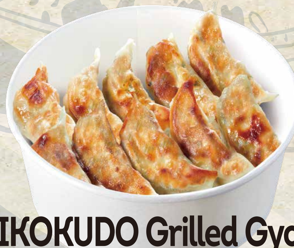
400 ICHIKOKUDO Grilled Gyoza 壺鶴堂の焼き餃子 5pcs 5.90 10pcs 11.80

*Served with bonito flakes sprinkled on top.