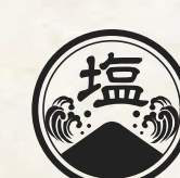
202 SHIO Spicy Ramen 塩スパイシーラーメン 13.90