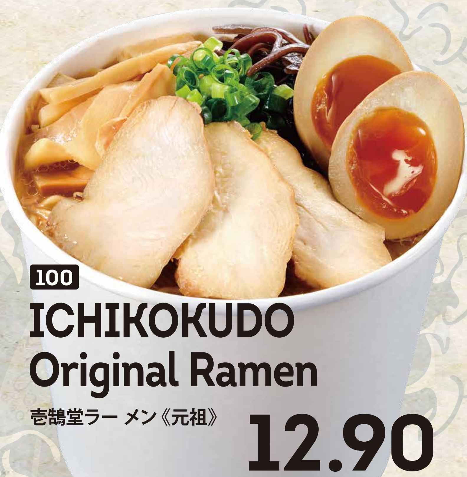
100 ICHIKOKUDO Original Ramen 壺鶴堂ラーメン《元祖》 12.90