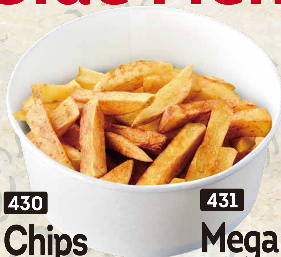
430 Chips フライドポテト 3.90