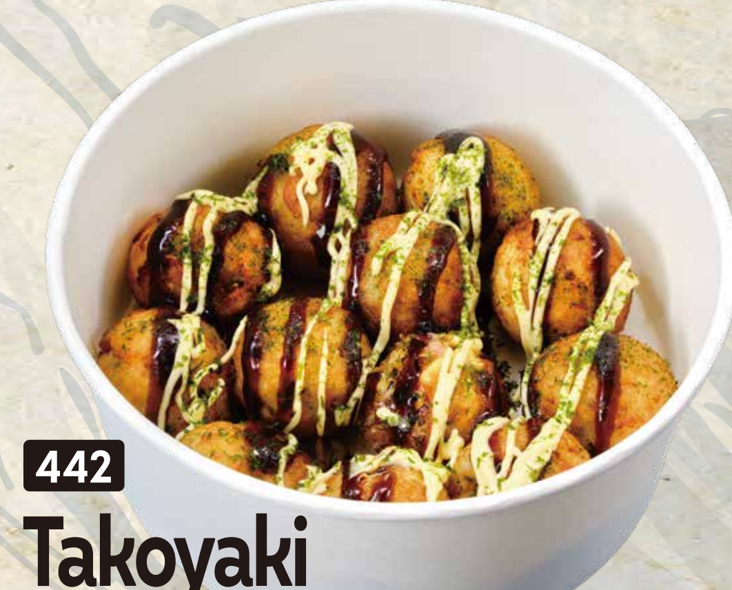
442 Takoyaki たこ焼き 12pcs 17.80

*Served with bonito flakes sprinkled on top.