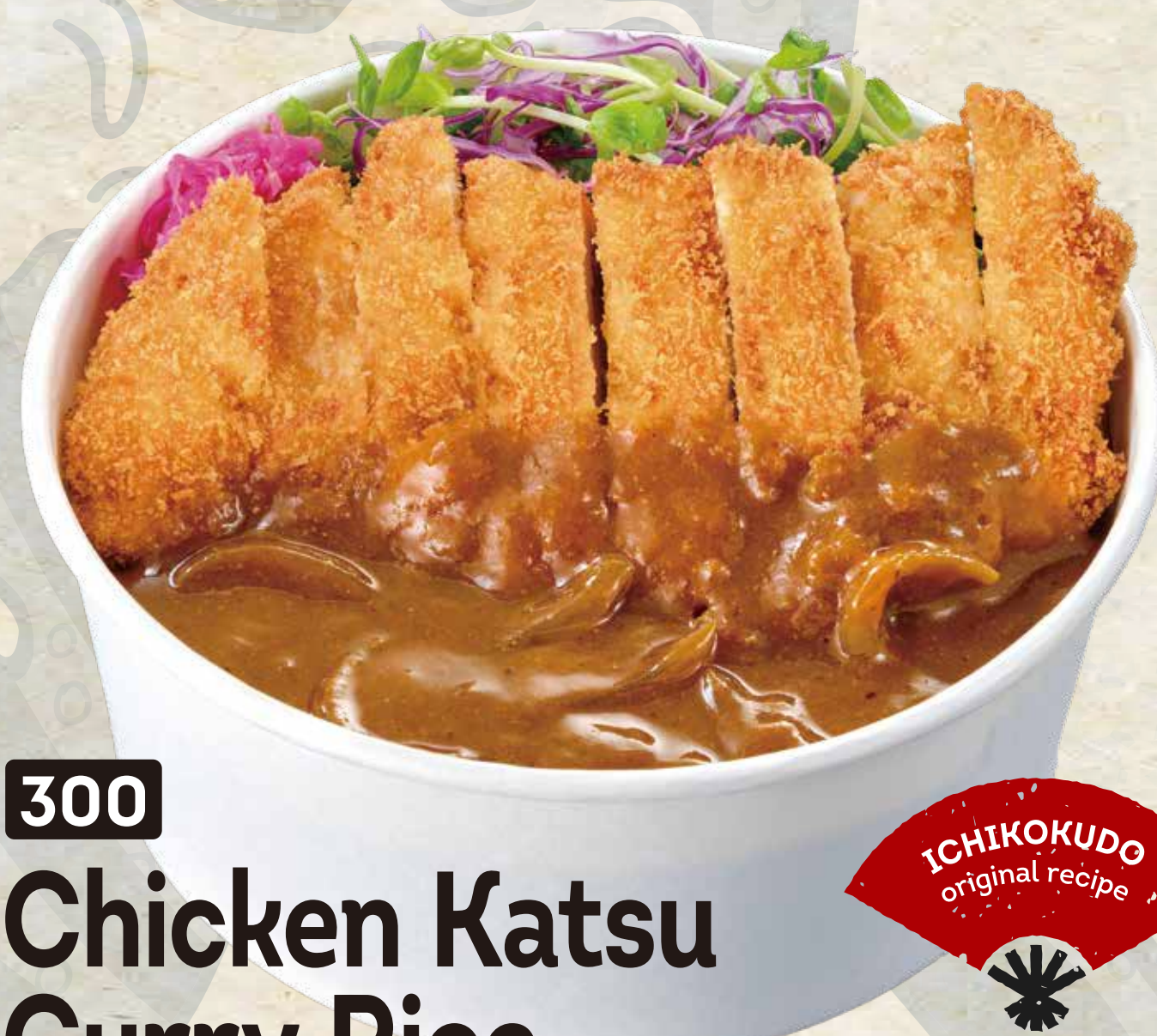
300 Chicken Katsu Curry Rice チキンカツカレー 13.90