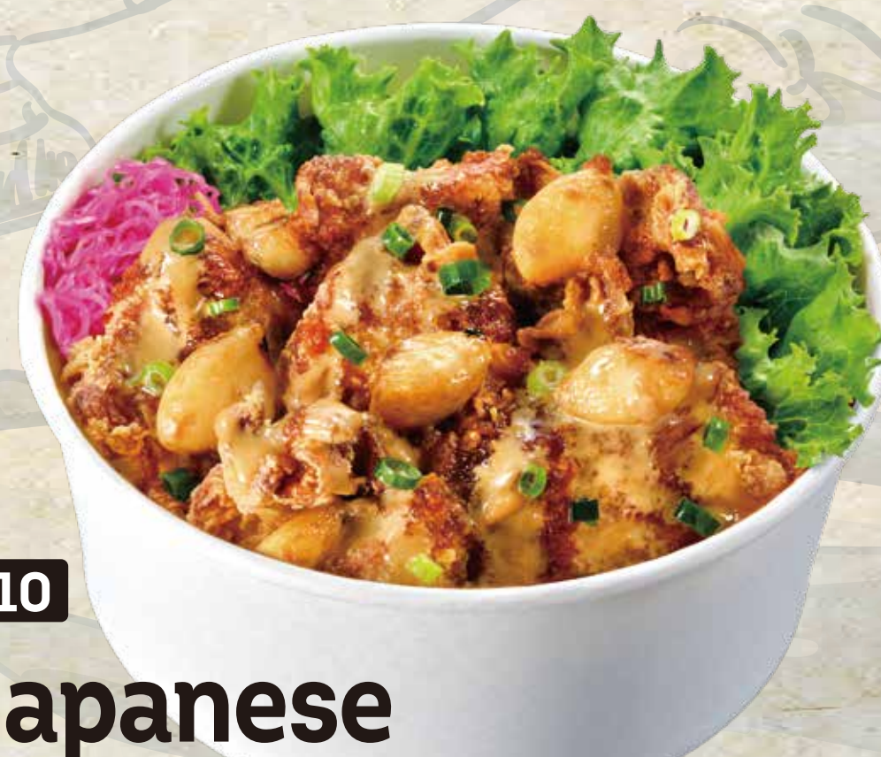
410 Japanese Garlic Karaage 和風にんにく唐揚げ 7.90