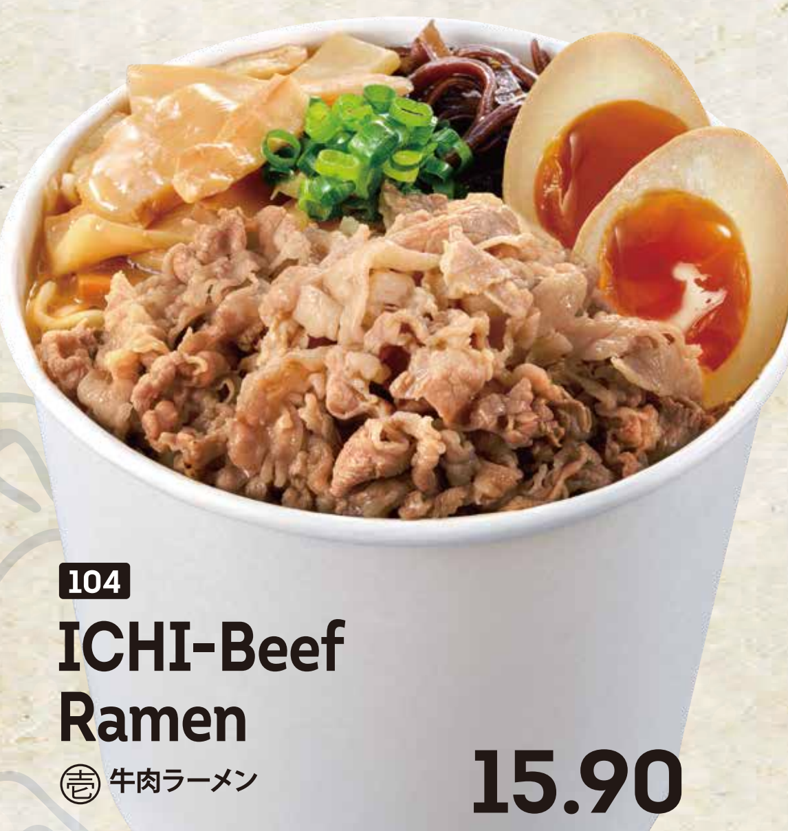
104 ICHI-Beef Ramen 牛肉ラーメン 15.90