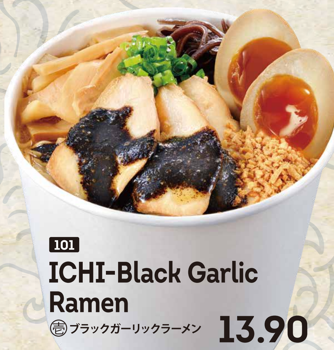
101 ICHI-Black Garlic Ramen ブラックガーリックラーメン 13.90